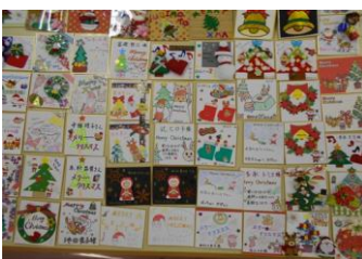
↑職員お手製のクリスマスプレゼント