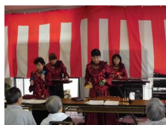
初めてのハンドベル演奏

皆さん、大変喜ばれ、アンコールをお願いされました。ブルーハーブのメンバーの方々も快くアンコール曲を奏でてください、拍手の喝采の中、観桜会を締めました。