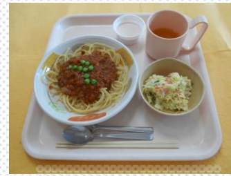
ミートスパゲティ