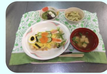
鯉のぼりを型どったちらし寿司

5月5日は子どもの日ということで、昼食は端午の節句献立でした。メニューは鯉のぼり寿司・たけのこといかの木の芽和え・すまし汁・抹茶プリンでした。見た目もかわいらしい鯉のぼり寿司は利用者の方の評判もよく、「とてもおいしい！」と言って食べられていました。