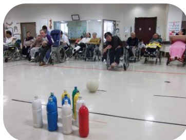
ボウリング ストライクを狙って… お見事！ストライク！！