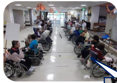
パトンリレー 拡大するとこんな感じです (^) 人から人への輪のリレー