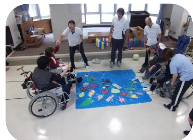
魚釣り 大きな魚釣ってね！