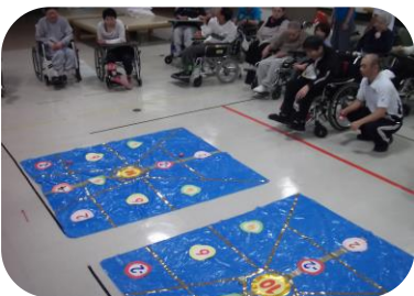
ペタンク 何点かなあ?? 高得点の連続?