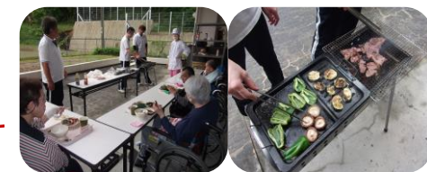
昨年のバーベキューの様子です

今年も 5 日と 12 日の 2 回に分け、委託業者による施設全館害虫駆除が行われました。消毒することにより隠れていた虫たちも逃げ場がなくなり、施設の中も清潔が保たれます。利用者みなさんも快適に生活していただくことができます。