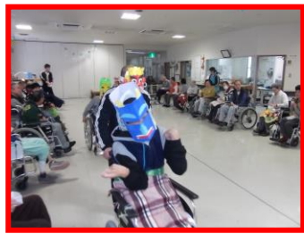
←見事に鬼になりきり、 みなさんを楽しませて くださいました。