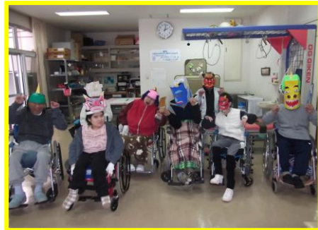
↑鬼役のみなさん☆ 始まる前から鬼になりきり、気合い十分です。

手作りのお面で鬼に扮した利用者が登場すると、みなさん一斉に豆を投げ、1年の健康を願いました。鬼役の利用者の方は豆を投げられて痛そうでしたが、全力で鬼を演じきってください、今年もにぎやかな豆まきとなりました。