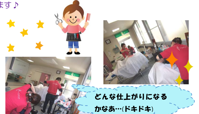
どんな仕上がりになるかなあ…(ドキドキ)

「髪や」さんがシャインへ来て下さるようになってから15年以上が経ちます(^_^)。これからも宜しくお願いします♪