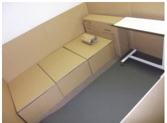
ダンボール製簡易ベッド