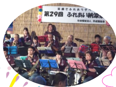
次は何の曲かなあ～ (*^_^*)

最後は、幕山太鼓の和太鼓です。多種多様な音楽に合わせて演奏される太鼓の音色は、ずっしりと会場内に響きわたり迫力ある演奏でした。