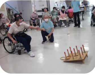
空き缶を倒さないように