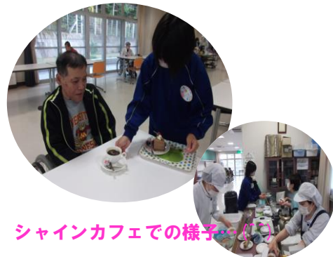
シャインカフェでの様子

11月15日から17日の3日間トライやるウィークが実施され、約10年ぶりに上津中学校から1名来られました。利用者の方とコミュニケーションをとったり、サークル活動のお手伝い、オセロゲームなどをしました。3日間という短い期間でしたが、緊張しながらも職員の説明を真剣に聞く姿や明るく元気な笑顔に職員も利用者の方も元気をもらいました。