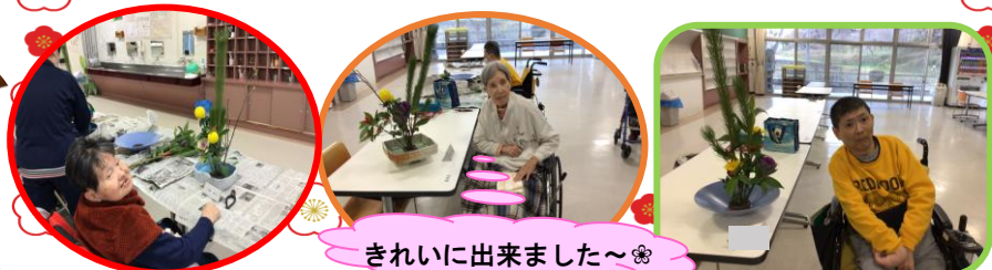
きれいに出来ました〜

皆さん何度も抜き差しして、試行錯誤しながら納得のいく形に仕上げておられました。完成した生け花は玄関や廊下に飾られ、華やかな新年をお迎えできました(°^_^°)