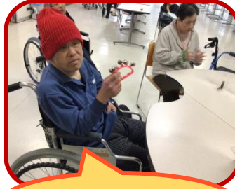
沢山盛り上げました♪