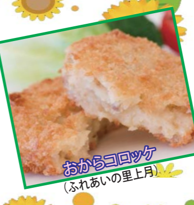
おからコロッケ (ふれあいの里上月)