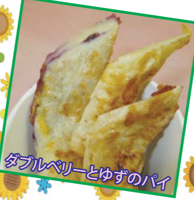
ダブルベリーとゆずのパイ