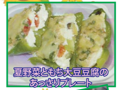
夏野菜ともち大豆豆腐の あっさりプレート