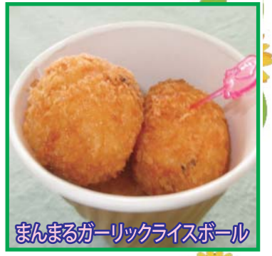
まんまるガーリックライスボール