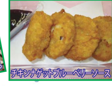
チキンナゲットブルーベリーソース