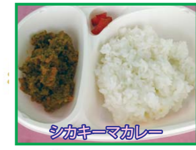
シカキーマカレー