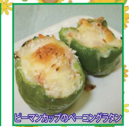
ピーマンカップのベーコングラタン (平谷製麺所うどん)