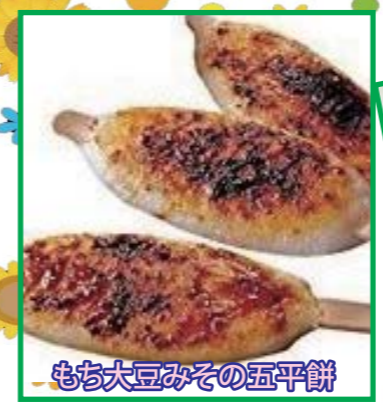
もち大豆みその五平餅