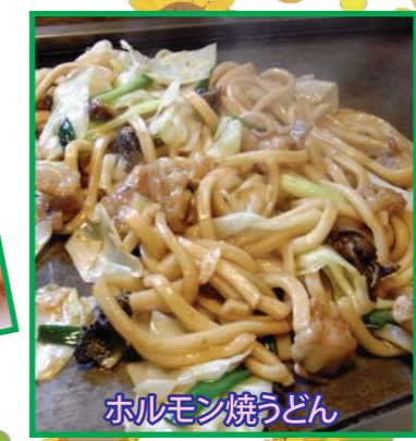
ホルモン焼うどん