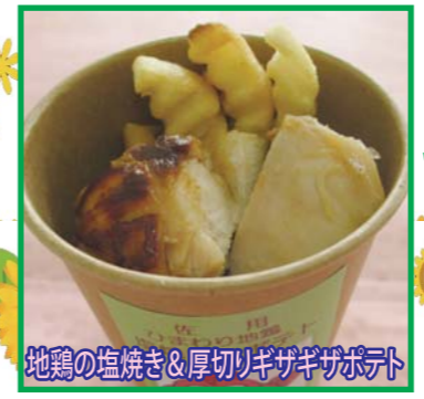
地鶏の塩焼き&厚切りギザギザポテト