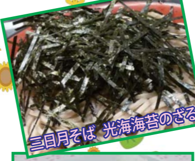
三日月そば 光海海苔のざる