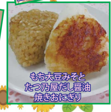
もち大豆みそと たつ乃屋だし醤油 焼きおにぎり