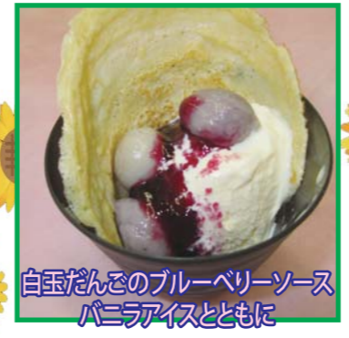
白玉だんごのブルーベリーソース パニアアイスとともに